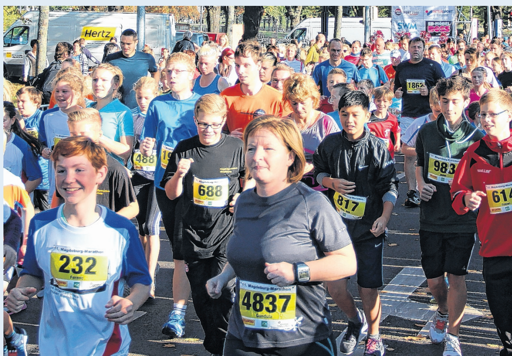
Mit über 6000 Teilnehmern erlebte der Magdeburg Marathon im Vorjahr einen neuen Rekord.

Wettbewerbe / Zeitplan: • 9.15 Uhr – Marathon (Mindestalter 18 Jahre, Hauptwertungsstrecke) • 9.30 Uhr – Elbe-Biber-Kinderlauf (400 Meter, Jahrgang 2009 und jünger) • 10 Uhr – Halbmarathon und 10-Kilometer-Lauf (beides Hauptwertungsstrecken für Männer und Frauen sowie U20, der 10-Kilometer-Lauf ist Hauptstrecke für U18, U16 und U14)