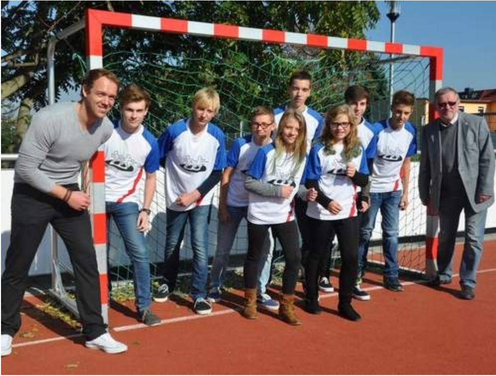
Zusammen stark: Insgesamt laufen 546 Schüler der Ecole-Schulen die Zehn-Kilometer-Stecke in Magdeburg.