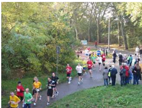
Raus aus dem Stadtpark gehts zurück Richtung Elbauenpark