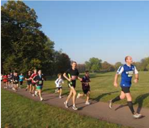
Durch den Stadtpark zwischen Stromelbe und Alter Elbe