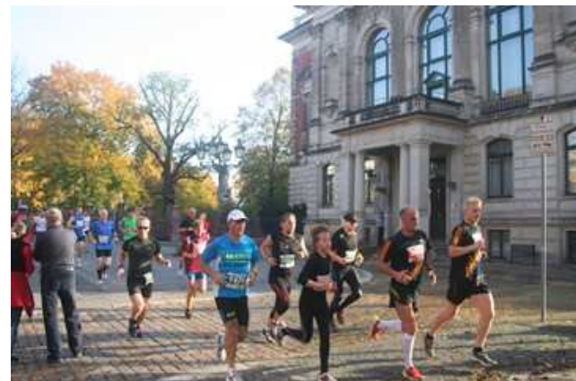
Vorbei am Fürstenpalais, Sitz des Ministerpräsidenten Sachsen-Anhalts

Dass unter dem Strich dennoch eine neue Rekordmarke vermeldet werden konnte, lag also am Rahmenprogramm. Beim Mini-Marathon über 4,2km, dem Elbe-Biber-Kinderlauf (400m) und den verschiedenen Nordic-Walking-Wettbewerben (21, 1/13/4,2km) stiegen die Zahlen teils kräftig an. Insofern ist die Zufriedenheit der Veranstalter dann doch wieder absolut berechtigt. So viele Teilnehmer gab es eben wirklich noch nie beim Magdeburg ‚Marathon‘, auch wenn der namensgebende Lauf zumindest quantitativ dazu weniger beigetragen hat als die zahlreichen Neben-Wettbewerbe. Für den Erfolg einer ‚Volkslauf-Veranstaltung‘ ist das aber auch nicht wirklich entscheidend, interessiert vielleicht mehr die Statistiker und reinen Marathon-Freaks.