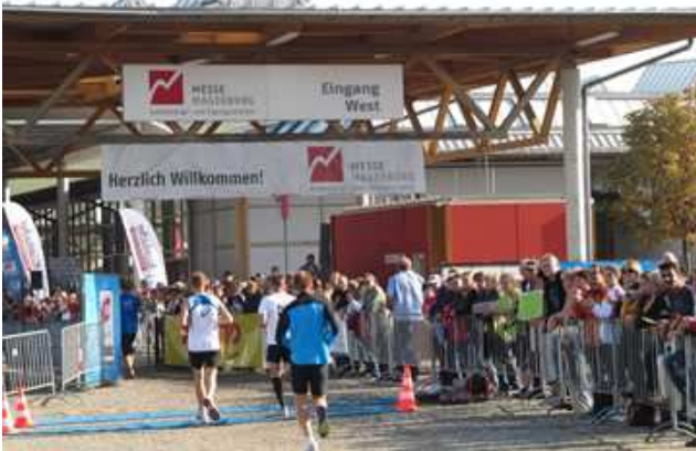
An den Messehallen gehts ins Ziel