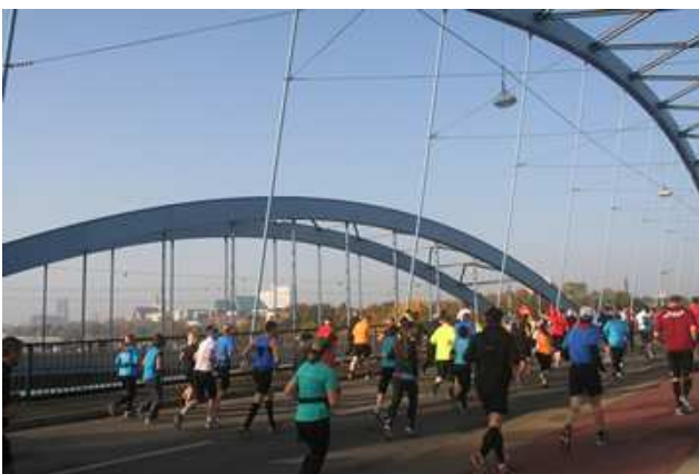
Über die Jerusalem-Brücke mit Stadtblick gehts in die City