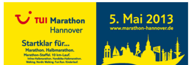
Banner anklicken - informieren LR Info zum Hannover Marathon HIER