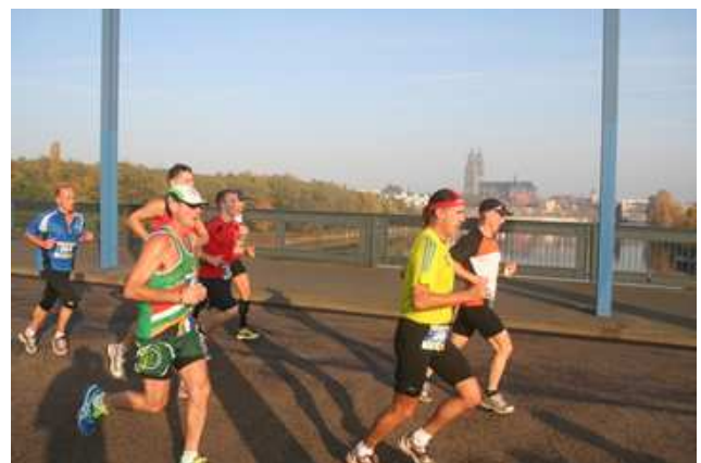
Über die Sternbrücke mit Dom-Blick in den Stadtpark