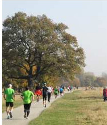
Über den Elberadweg in die Elbwiesen geht es Richtung Wasserstraßenkreuz