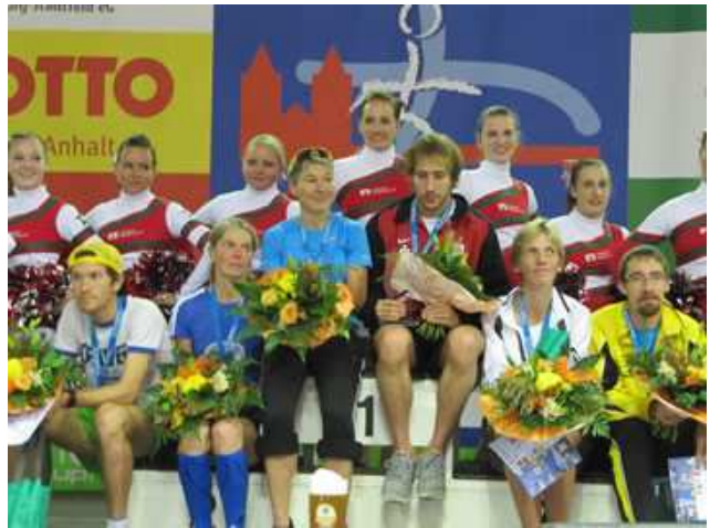
Die schnellsten Marathon-Männer und -Frauen umrahmt von Cheerleadern