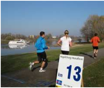
Laufen mit Elbeblick - nicht nur bei KM13