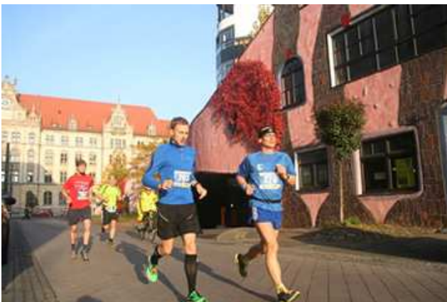
Bei Km 4 vorbei an Hauptpost und Hundertwasserhaus