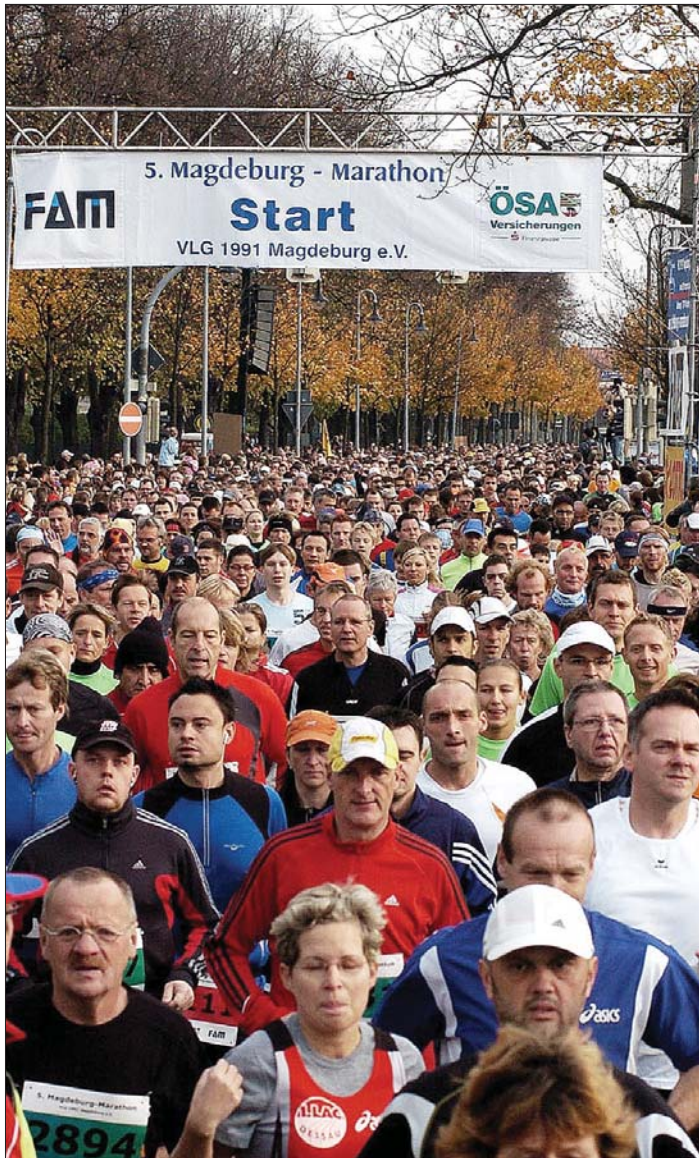
Das war im Vorjahr nicht nur ein besonders herrlicher Herbsttag, auch das bunte Läuferfeld mit 4804 Teilnehmern verlieh dem 5. Magdeburger Marathon einen weiteren riesengroßen Farbtupfer.

Zwischen Dom und Blauem Kreuz kann man sich beim klassischen Marathon über 42,195 Kilometer, beim Halbmarathon oder bei der 13 Kilometer langen Strecke versuchen. Die Volkslaufgemeinschaft 1991 Magdeburg, die im Oktober 2004 diesen Magdeburger Marathon aus der Taufe gehoben hat, bietet den Läufern auch in diesem Jahr eine anspruchsvolle und abwechslungsreiche Strecke: Es geht zum einem durch die 1200-jährige Elbestadt, vorbei am Otto-von-Guericke-Denkmal, Rathaus, Magdeburger Reiter, Hundertwasserhaus und dem Dom und zum anderem in die herbstlich bunte Elbauenlandschaft mit dem Jahrtausendturn bis hin ins Ziel auf dem Messegelände. Beim großen Marathon müssen die Läufer allerdings dann weiter über den Elbradweg nach Lostau und Höhenwarthe bis zum Wasserstraßenkreuz und von dort aus zurück laufen. Die Veranstalter haben auch an die Jüngsten gedacht, die können beim Elbe-Biber-Lauf über 400-Meter ihr Können unter Beweis stellen. Richtig los geht es mit dem Startschuss des Magdeburger Oberbürgermeisters um 10 Uhr in der Herrenkrugstraße in Höhe des Messegeländes. Für Spätentschlössene gibt es noch Möglichkeit, sich kurzfristig in das Läuferfeld begeben zu können: Nach- und Ummeldungen sind also noch am 17. und 18. Oktober im Rahmen der Startnummernausgabe gegen eine Nachmeldegebühr möglich. Weitere Informationen gibt es unter www.magdeburg-marathon.eu .